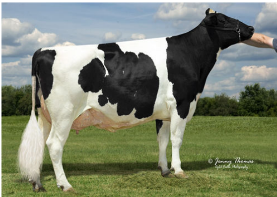
MCCOL CELTIC 10003