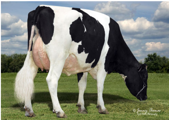
MCCOL CELTIC 10003