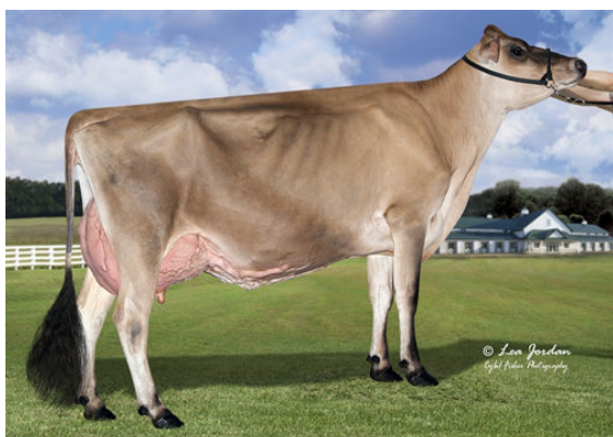
RIVER VALLEY LSTWL MACNCHEZ 5055