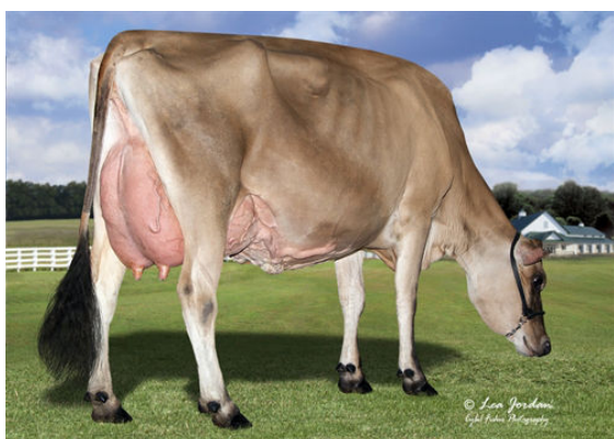
RIVER VALLEY LSTWL MACNCHEZ 5055 DAM