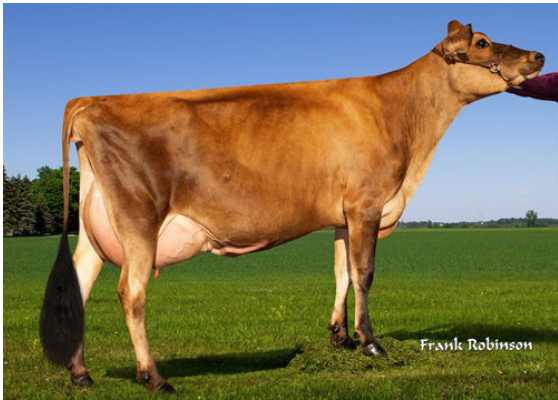
JX VIERRA GYSPY {4}