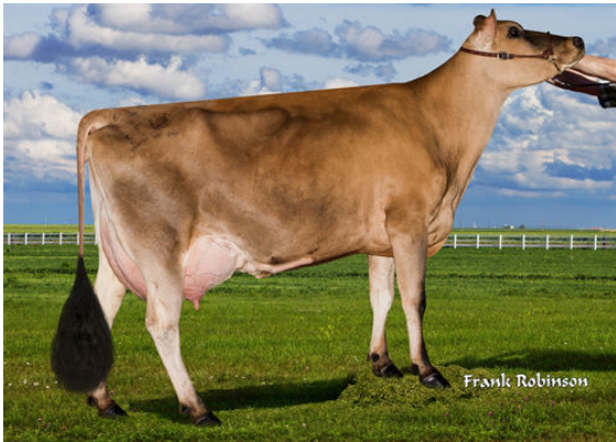
JX FARIA BROTHERS HULK YAYA TOURE {2}