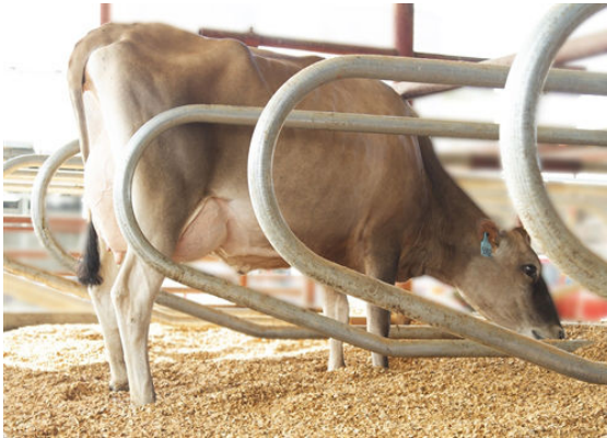
JX PROGENESIS BNCROFT DEJA {6} DAM