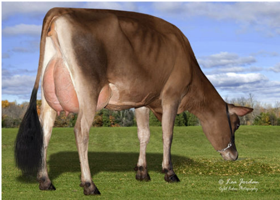
JX GENERATIONS JAMMER DORA {5} THIRD DAM