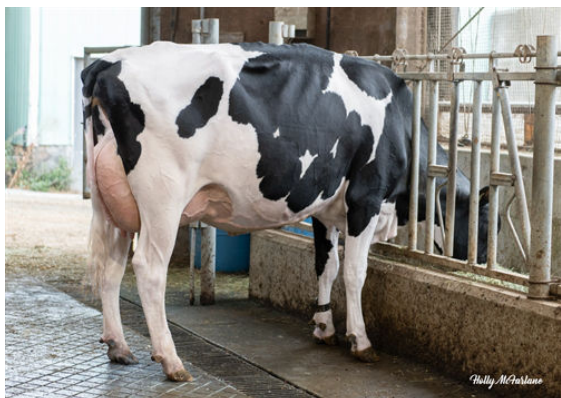
PROGENESIS ZAZZLE MEEKO GRANDDAM