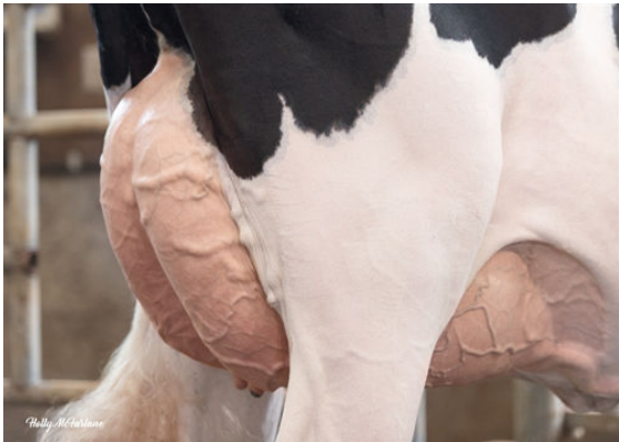
PROGENESIS MAGNIFIQUE PROUD DAM