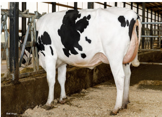
REGAN-DANHOF DELUX CLARE DAM