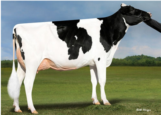
REGAN-DANHOF JEDI CASHMERE FOURTH DAM