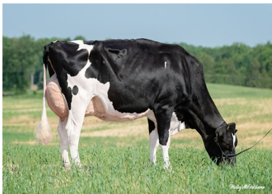
DULET D-LAMBDA KATRINA