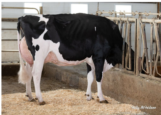
DULET D-LAMBDA KATRINA