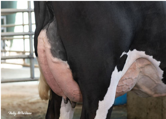
WESTCOAST FSTBL FAR8167 10707 DAM