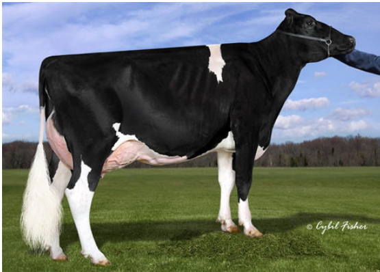
VIEW-HOME MRDIAN IOWA FOURTH DAM