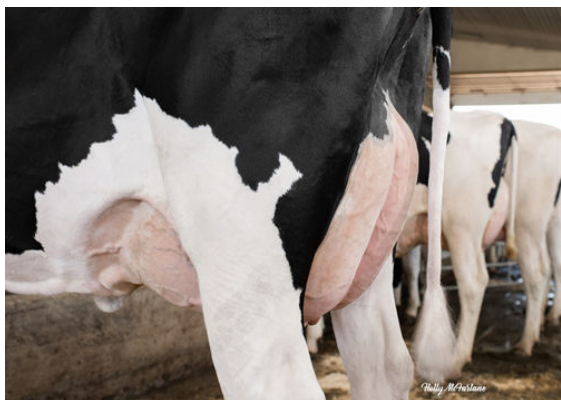
PROGENESIS FORTUNE PALAU THIRD DAM