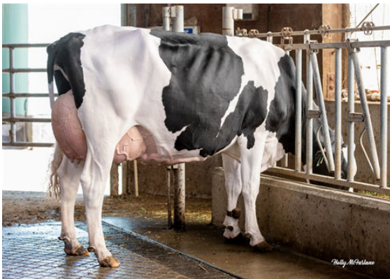
PROGENESIS EINSTEIN RUDY DAM