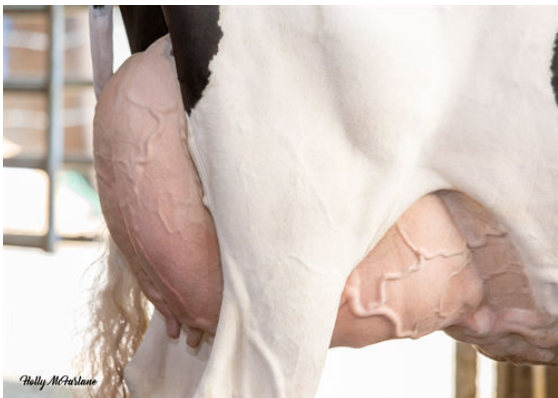
PROGENESIS EINSTEIN RUDY DAM