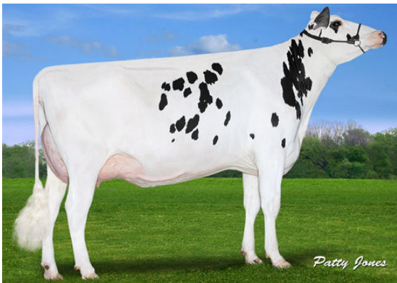
CLAYNOOK COLITA BOMBERO FOURTH DAM