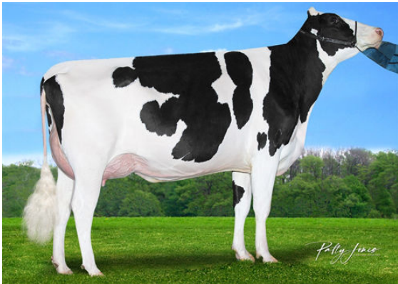
CLAYNOOK CHRIS RENEGADE DAM