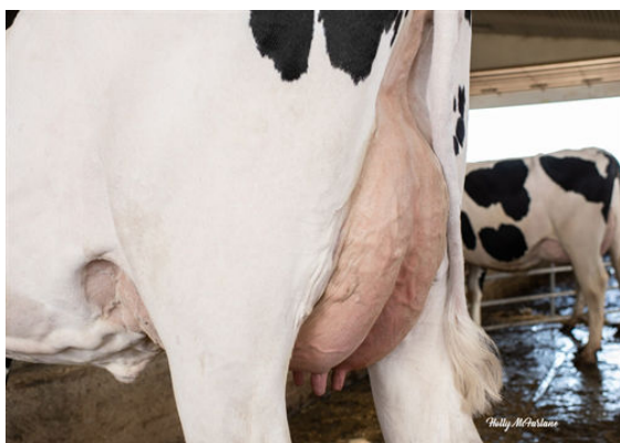
PROGENESIS TOPNOTCH BRAVE GRANDDAM