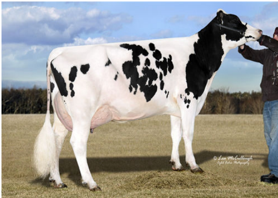
VISION-GEN SH FRD A12276 FIFTH DAM