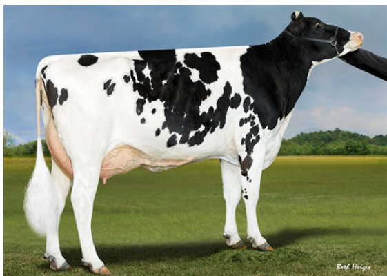
BOMAZ MEDLEY 8072