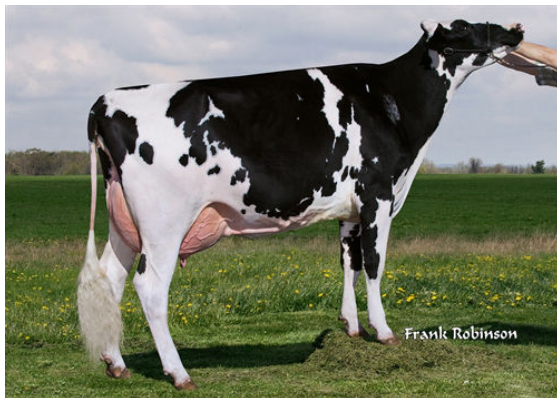
CABERNET GWN SHINE FIFTH DAM