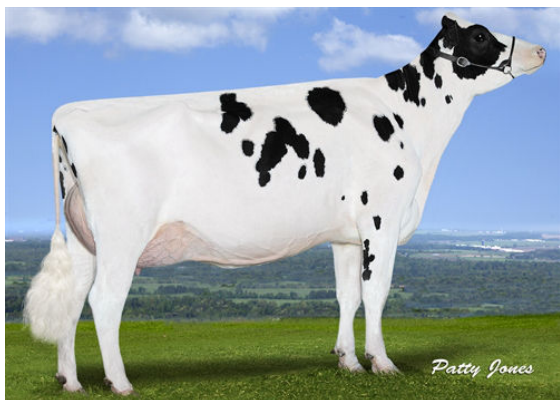
EDG DAHLIA MOGUL 2257 FOURTH DAM