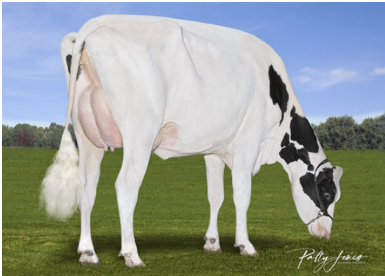
VICTORIA BANDARES HOPE DAM