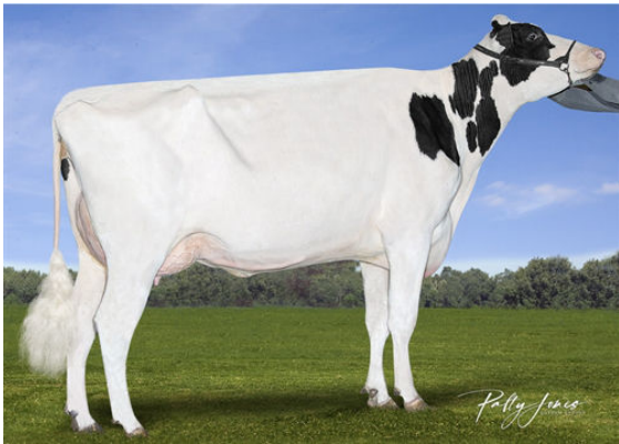
VICTORIA BANDARES HOPE DAM