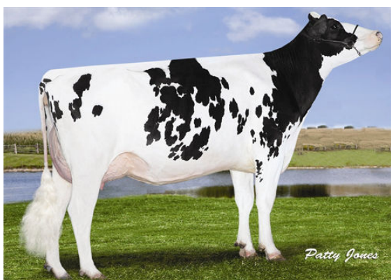
RUSSELLWAY CAMERON PINKY