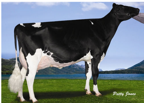
MS CHASSITY GOLDWYN CASH FIFTH DAM