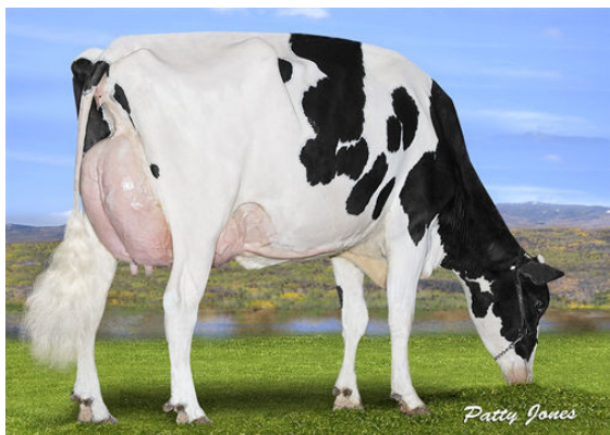
PROGENESIS DENVER BETSY