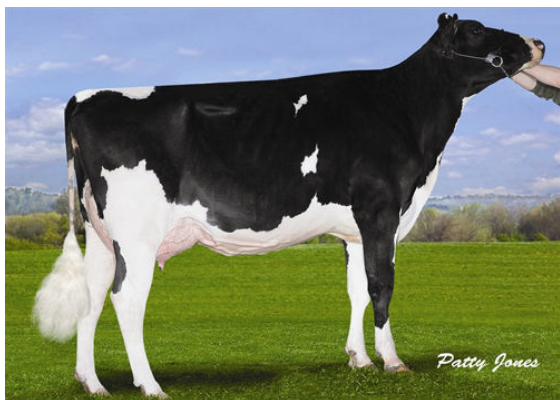
MS LOOKOUT PESK BKM BRIA