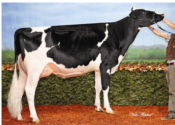
RALMA-RH MANOMAN BANJO