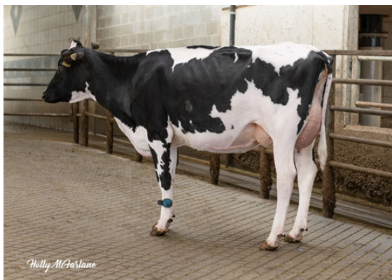
WESTCOAST MLIRE FAR8391 11926 DAUGHTER