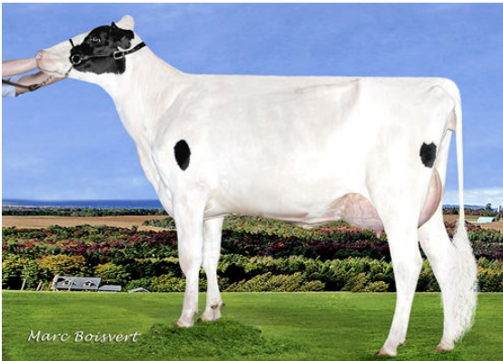
DUDOC MAGNA REQUIEM P FOURTH DAM