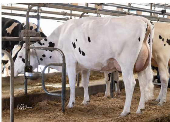
MONTMAGNY PRAGMATIC SAFARIA