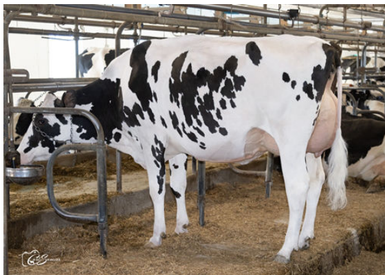
MONTMAGNY PRAGMATIC SAFALA

L TO R - MONTMAGNY PRAGMATIC SAFARIA, MONTMAGNY PRAGMATIC SAFALA