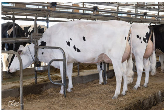
PRAGMATIC DAUGHTER GROUP

L TO R - MONTMAGNY PRAGMATIC SAFARIA, MONTMAGNY PRAGMATIC SAFALA