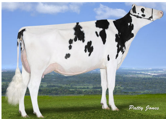
PROGENESIS KINGBOY FAITH GRANDDAM