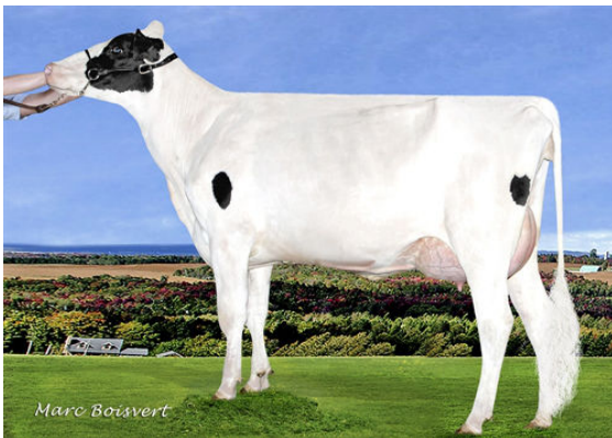
DUDOC MAGNA REQUIEM P FOURTH DAM