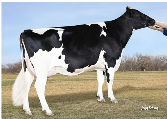
ROYLANE SHOT MINDY 2079 FOURTH DAM