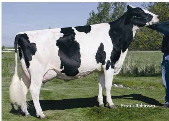
SEAGULL-BAY MANAT MIRAGE FIFTH DAM