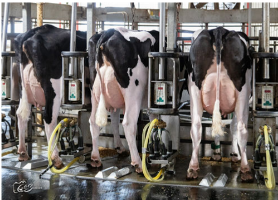
MILKTIME DAUGHTER GROUP

L TO R - DRAGON MILKTIME 4204, DRAGON MILKTIME 4202, DRAGON MILKTIME 2236