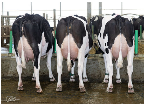
MILKTIME DAUGHTER GROUP

L TO R - DRAGON MILKTIME 4204, DRAGON MILKTIME 4202, DRAGON MILKTIME 2236