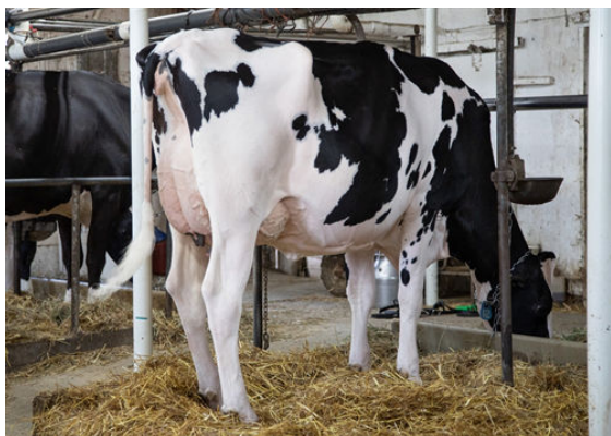
REPA KINA LIGHTHOUSE