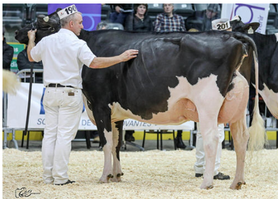
HAVENVALLEY LIGHT BOBBYHOE DAUGHTER