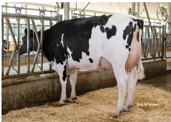
MAPLEVUE LIGHTHOUSE DAFFODIL