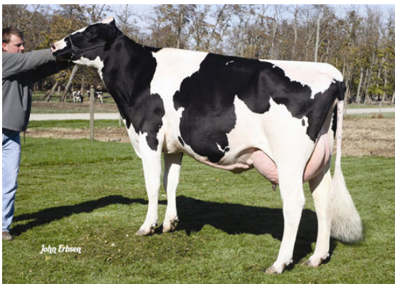
CROCKETT-ACRES ELITA FOURTH DAM