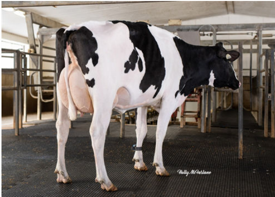
ATHLONE ADAGIO MONCTON