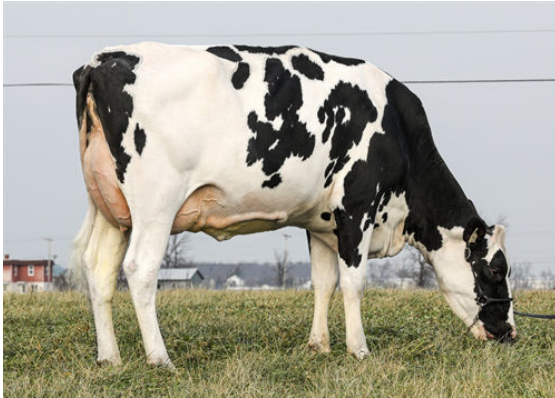
BASETTA DIGBY ADAGIO P