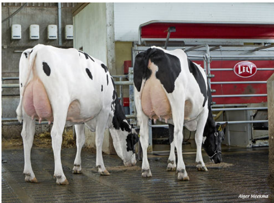
STANTONS APPLICABLE DAUGHTERS

L to R - ZANDENBURG APLI EBONY - ZANDENBURG APLI CAMILA