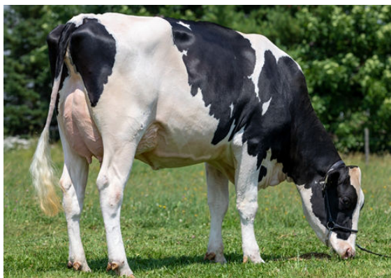
GYVIE EUCLID GREYJOY