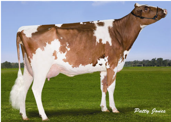
CHERRY CREST COLT BAMBI P