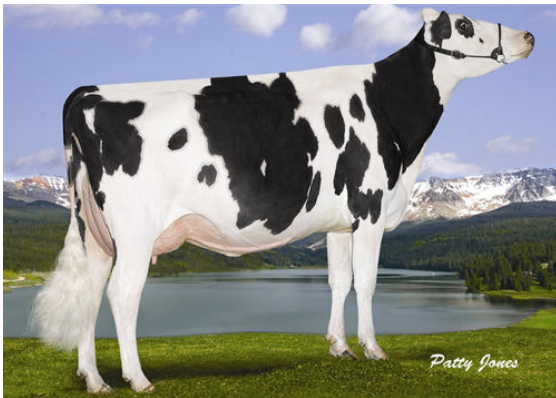
ROCKYMOUNTAIN SUPER LEITA