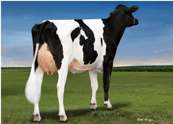
OH-RIVER-SYC MOGAL BRYLAN FOURTH DAM