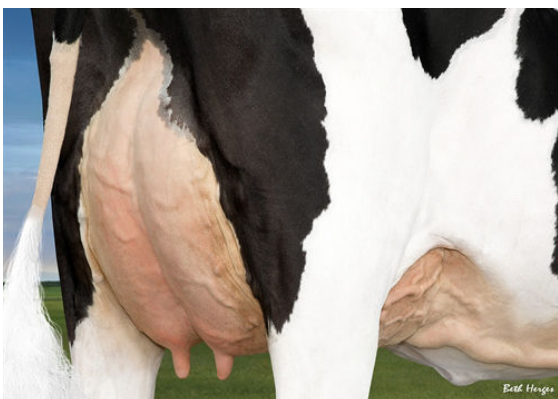
OH-RIVER-SYC MOGAL BRYLAN FOURTH DAM