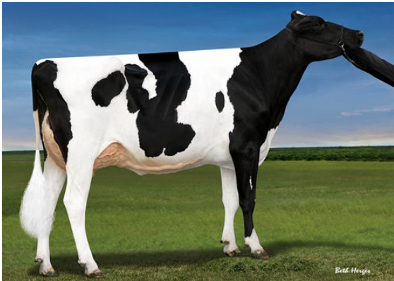
OH-RIVER-SYC MOGAL BRYLAN FOURTH DAM