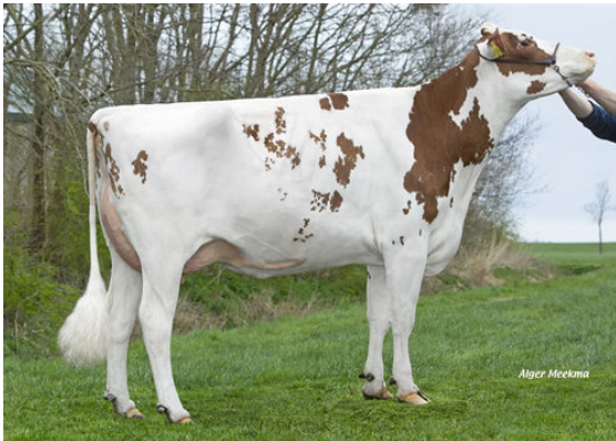
LAKESIDE UPS RED RANGE DAM