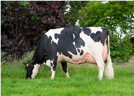
DE OOSTERHOF DG ROSE D GRANDDAM