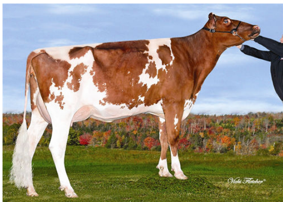
DUDOC MITEY PESTICIDE P RED