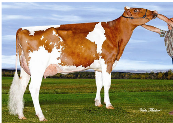
LORKA ILLEGAL PESTE PO