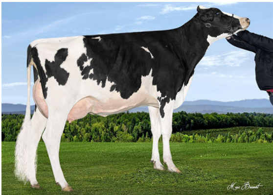
MICHERET EUJENNY BREKEM