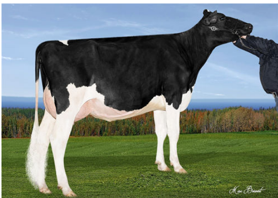
VIVEJOIE EMILI BREKEM