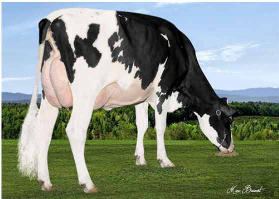
MICHERET EUJENNY BREKEM