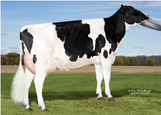
HILLTOP-LLC JESUALDO 6060