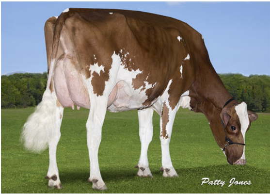
GREENVIEW SYMPATICO JOLENE