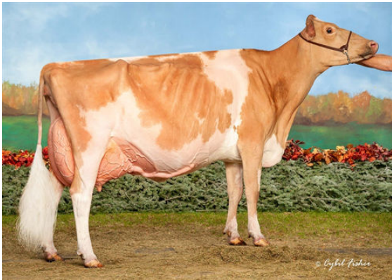
VALLEY GEM ATLAS MALT DAM