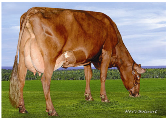
KAMOURASKA ORRA XUBY GRANDDAM