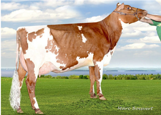
DUO STAR ATHENA DAM