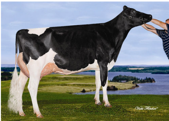
LINDENRIGHT GOLDWYN MYSTICAL FOURTH DAM