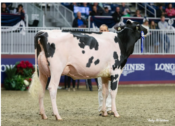
BLONDIN STARS ALICE DAUGHTER