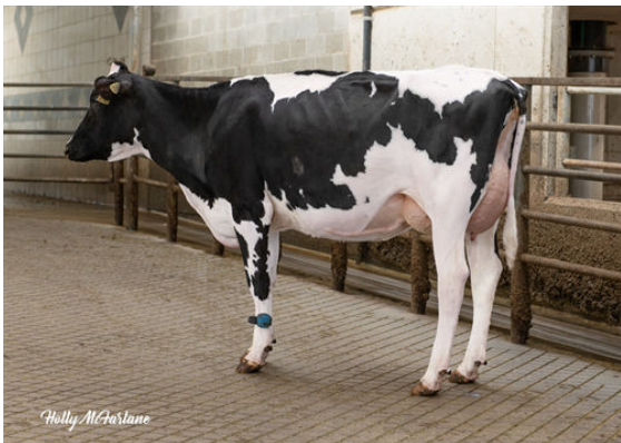
WESTCOAST MLIRE FAR8391 11926 DAUGHTER